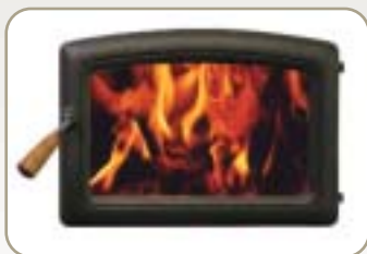
Porte voûtée Noir métallique