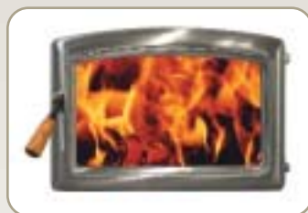
Porte voûtée Nickel brossé