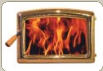
Porte voûtée Or