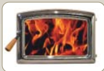
Porte voûtée Nickel